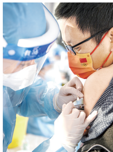
北京大兴开展新冠疫苗加强针接种工作

接种后, 按规定留观30分钟; 保持接种局部皮肤的清洁, 避免用手搔抓接种部位。