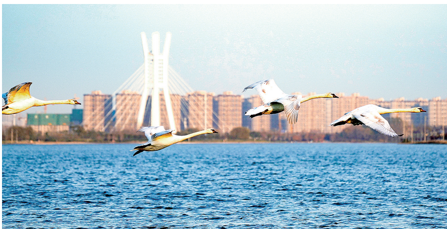
11月18日下午初冬的北龙湖,天鹅在自由飞翔。

提醒广大乘客,乘坐地铁时请配合地铁工作人员的引导,全程佩戴口罩、核验健康码、进行体温测量。地铁线网各车站均支持手机扫码进出站服务,您可使用郑州地铁·商易行APP扫码进站。