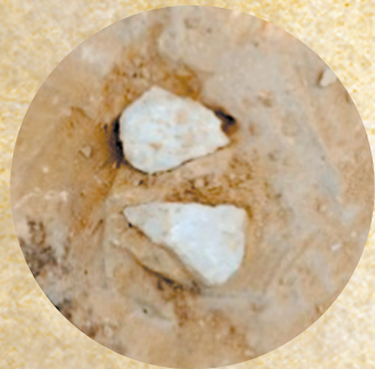
老奶奶庙遗址出土的 石制品