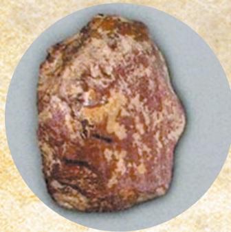
织机洞遗址出土的 砾石石器