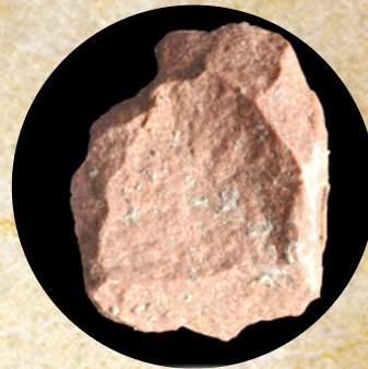
赵庄遗址出土的 石英砂岩工具