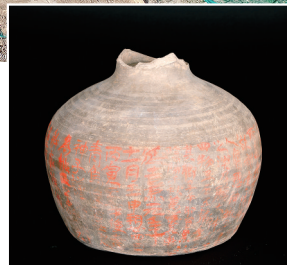
延熹元年朱书陶罐

新华社电 12月9日,陕西省文物局召开咸阳洪渎原墓葬考古新发现新闻发布会。陕西考古工作者经过一年多的发掘工作,在咸阳市渭城区发掘了自战国至明清时期古墓葬3600余座,其中有多组东汉至隋唐时期的家族墓地,包括墓主为唐玄宗李隆基表弟、武则天表兄等高等级贵族的墓葬。目前已发掘的中大型墓葬占比大,纪年墓葬数量多,出土文物丰富。