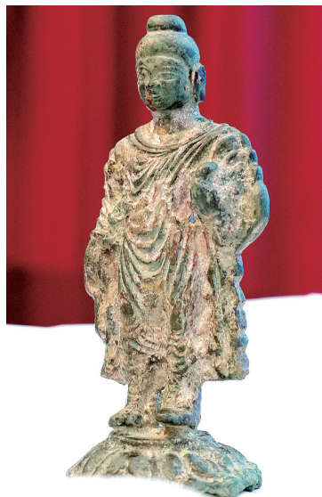
金铜释迦牟尼立像