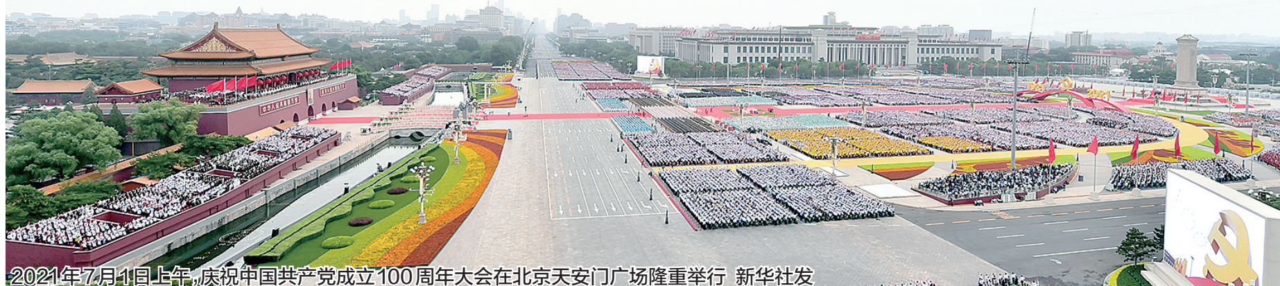
2021年7月1日上午,庆祝中国共产党成立100周年大会在北京天安门广场隆重举行