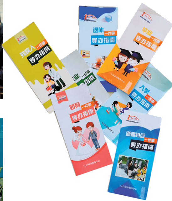
“民生一件事”《服务指南》

本报讯 今年,二七区深入贯彻落实省市关于“放管服”和“一网通办、一次办成”政务服务改革工作部署,围绕“最少、最优、最高、最好、最顺、最活”12个字做文章,精准实施“六大工程”,着力打造一流政务环境。