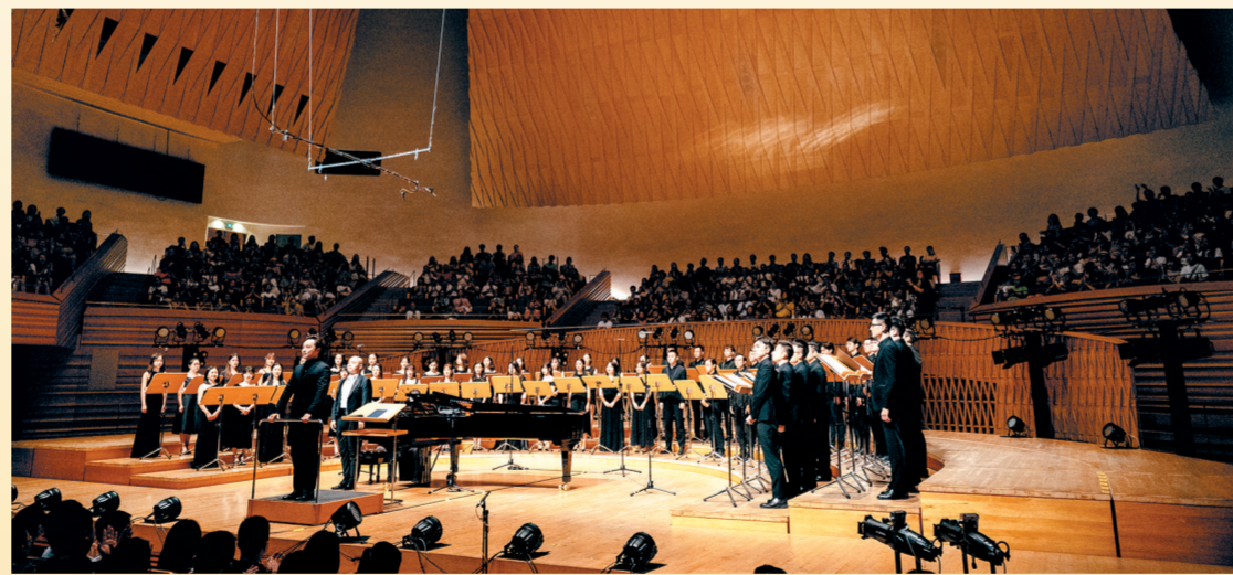
郑州大剧院彩虹合唱团演出火爆全网