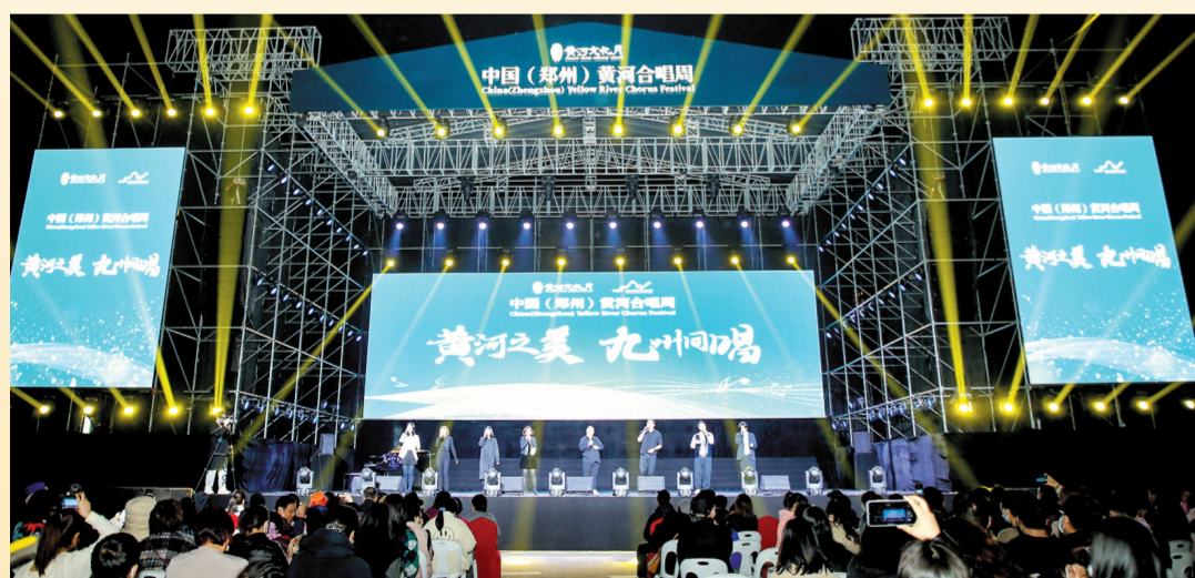
黄河合唱周吸引数千人现场观看

不断深化,惠济区持续不断加快推进沿黄农业结构调整,培育发展现代生态农业、观光农业等新型农业模式,建成市级现代农业示范园2个,培育提升全国休闲农业与乡村旅游星级精品园区3家,高标准打造美丽乡村示范村7个,并在此基础上,依托便利的交通优势、丰富的文化旅游资源,将农业与旅游业深度融合,打造休闲农业旅游精品线路10条,先后荣获“国家级农业示范区”“全国休闲农业和乡村旅游示范区”等荣誉称号。推动现代农业产业和美丽乡村建设融合发展,惠济区将多方发力,汇聚经济、文化、生态建设强音,持续推动黄河流域生态保护和高质量发展起步区建设。