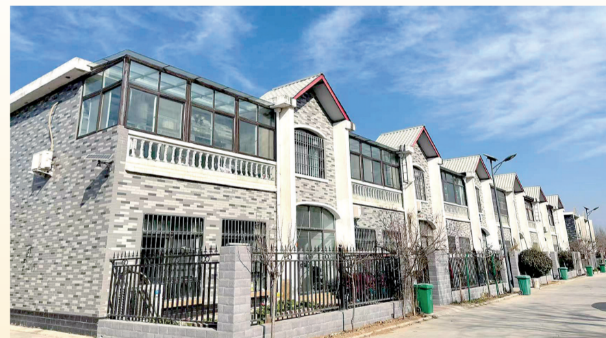
美丽乡村庄孙庄村

让沿黄村落的人们日子跟着美起来。随着黄河流域生态保护和高质量发展国家战略实施深入推进,以及郑州市对沿黄区域谋划“北静”发展定位的