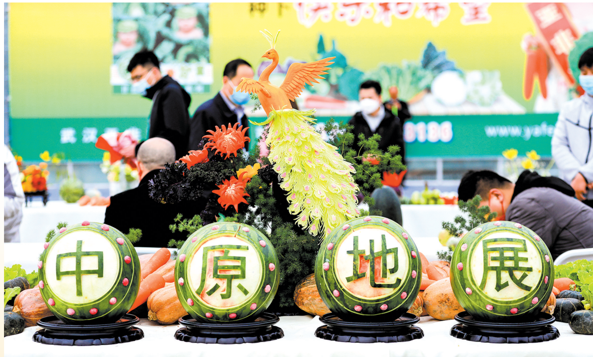
2021第三届郑州种业博览会暨第六届中原国际种业科技展览会现场

2021年由惠济区承办的两次盛会格外引人注目。一场是齐聚沿黄九省(区)合唱专业团队及爱好者的2021郑州黄河合唱周,一场是国内参展品类最多的第三届郑州种业博览会暨第六届中原国际种业科技展览会。站在黄河流域生态保护和高质量发展的舞台,惠济区勇担郑州示范区起步区之责任使命,把握时代脉搏、紧握历史画卷、弘扬黄河文化,着力打造具有惠济特色的黄河文化和产业发展品牌。