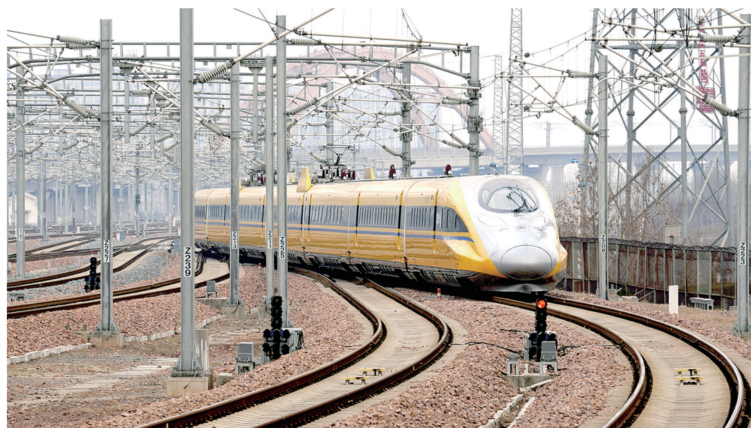
综合检测列车进行联调联试

记者昨日从中国铁路郑州局集团有限公司了解到,2月8日,济郑高铁濮阳至郑州段正式开始联调联试,综合检测列车的上线运行标志着线路开通进入倒计时。