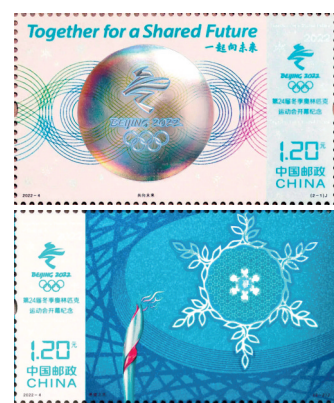
冬奥会开幕纪念邮票

本次冬奥纪念邮票由河南省邮电科技有限公司承担印制任务。他们从2021年10月中旬就参与到邮票前期的筹备工作中,公司成立了专门的团队,积极克服因保密工作需要、设计元素不能明确的难题,围绕邮票主题,大胆模拟、勇于创新,精心制订多个工艺方案。2022年1月初,该套邮票图稿确定后,河南省邮电科技有限公司百余名工作人员,以精湛的印制工艺,于方寸间完美地呈现了北京冬奥会开幕