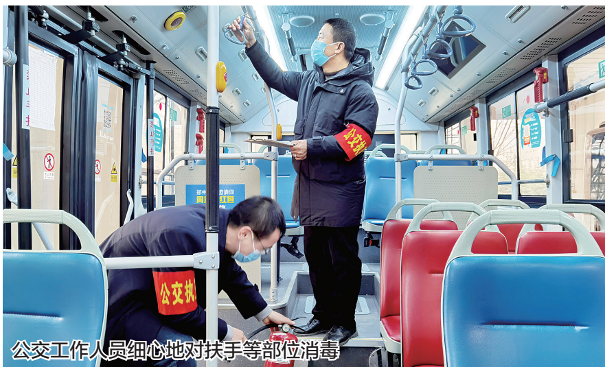
公交工作人员细心地对扶手等部位消毒

此外,还在车上放了百宝箱,里面装有口罩、免洗手液、文具、创可贴、常备药品等物品。