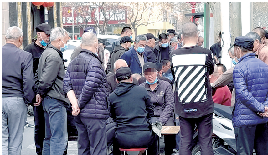
伊河路露天棋牌摊

昨日,记者暗访发现,省会多家商场能落实扫码、测温、戴口罩等疫情防控措施,大同路上的普乐天地商场大门却无人值守。而伊河路多处露天棋牌摊,无视疫情期不聚集的倡议,扎堆的人群让人很担忧。郑报全媒体记者 汪永森 文/图