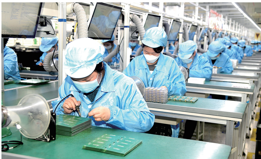
高新区河南新天科技股份有限公司车间

项智慧办理,保护中小企业政府采购合法权益,提升企业融资便利度,完善政府性融资担保体系,加强科技创新引领,促进进出口贸易发展,加强政务诚信建设,推广信用承诺制和告知承诺制等。