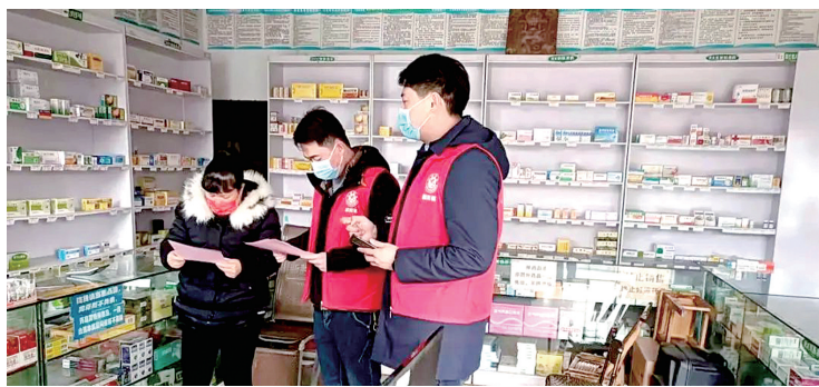
向商户宣传疫情防控政策

本报讯(郑报全媒体记者 袁建龙 通讯员 韩心泽 赵晓鹏 文/图)“最近家里有人外出过吗?有外地回家的吗?现在疫情形势严峻,请减少外出聚集!”昨日一大早,登封市各级“网格长”就在各自责任区逐户展开摸排,以掌握辖区群众出行动向。