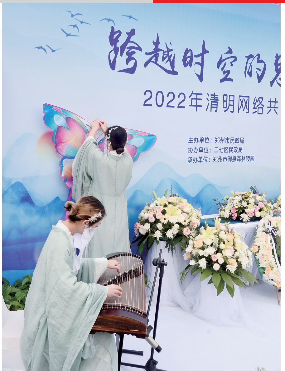
主办单位:郑州市民政局 协办单位:二七区民政局 承办单位:郑州市御泉森林陵园

据悉,疫情期间,御泉园还推出了网络纪念馆、代客祭扫等绿色、便捷的祭拜通道,帮助解决疫情期间清明祭祀的诸多难题。