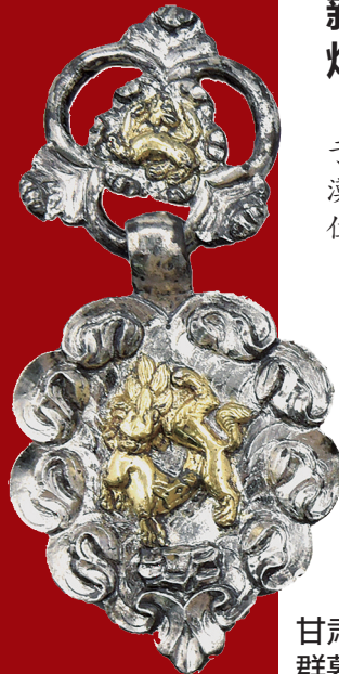
甘肃武威唐代吐谷浑王族墓葬群慕容智墓出土的鎏金银饰件

甘肃武威唐代吐谷浑王族墓葬群的发现使我们能够从文字和实物层面,生动揭示吐谷浑民族逐渐融入中华文明体系的历史事实。