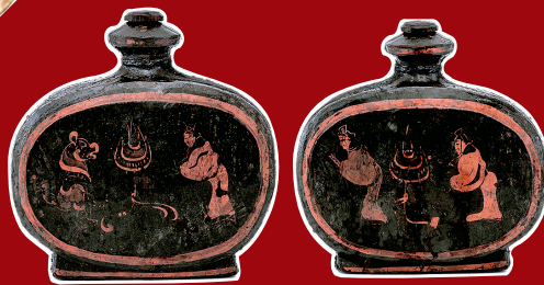
湖北云梦郑家湖战国秦汉墓地出土的扁壶