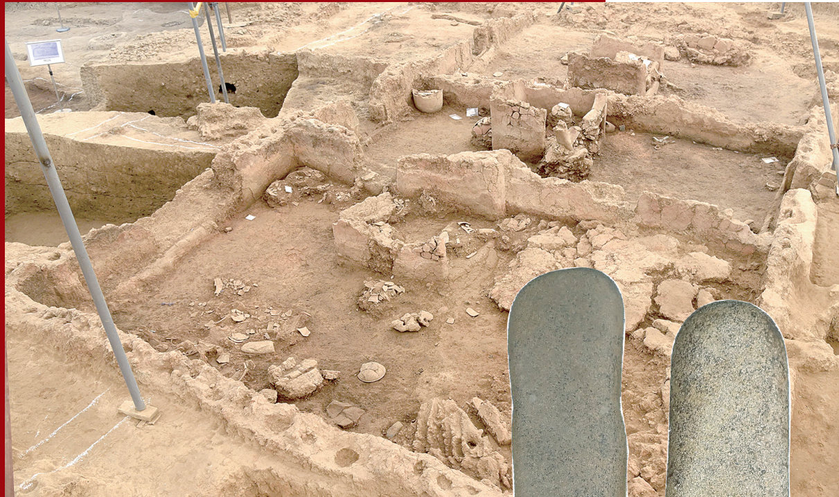
河南南阳黄山遗址出土的大型玉石器生产作坊

为进一步探索古人类征服青藏高原的历史过程,2019年以来,考古队员在川西高原展开旧石器时代考古工作,于2020年5月份调查发现皮洛遗址。