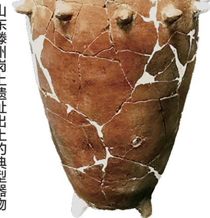
山东滕州岗上遗址出土的典型器物