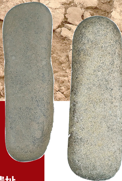
河南南阳黄山遗址出土的石质制玉工具

黄山遗址位于南阳市东北部卧龙区蒲山镇黄山村南、白河西岸,为探讨豫西南地区社会复杂化和文明化进程提供了关键材料。