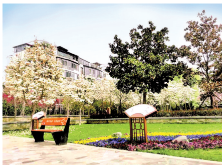
龙湖外环南路游园

近日,郑东新区的玉兰花、紫叶李竞相开放。繁花满树,艳丽芳香,千枝万蕊交相辉映,成为早春里一道绚丽的风景线。 最是春日好时光,一年美景莫错过。快来郑东新区赏花吧! 记者 王阳