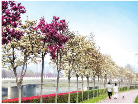
七里河(农业路至康平路)