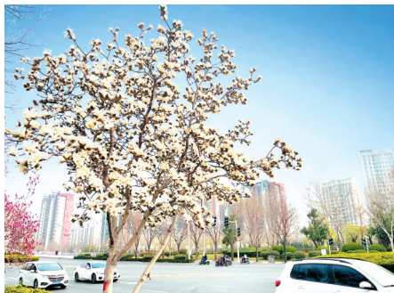
商鼎路(黄河路至七里河北路)