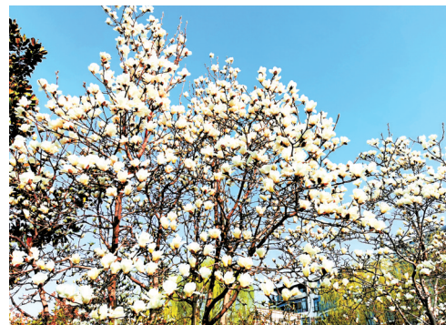
龙湖外环南路