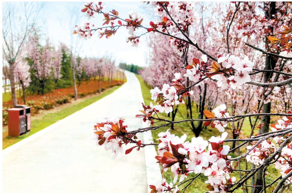
高铁公园

近日,郑东新区的玉兰花、紫叶李竞相开放。繁花满树,艳丽芳香,千枝万蕊交相辉映,成为早春里一道绚丽的风景线。 最是春日好时光,一年美景莫错过。快来郑东新区赏花吧! 记者 王阳