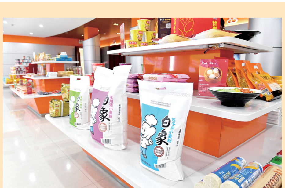
白象企业各种畅销产品