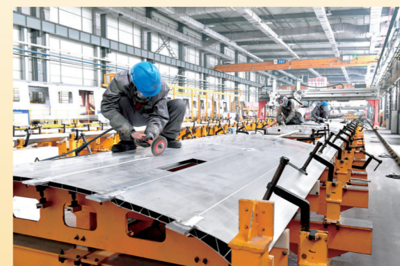
干净整洁的明泰交通新材料有限公司焊接车间