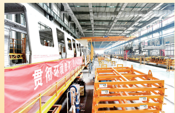
视野通透的车间成为新材料行业的翘楚