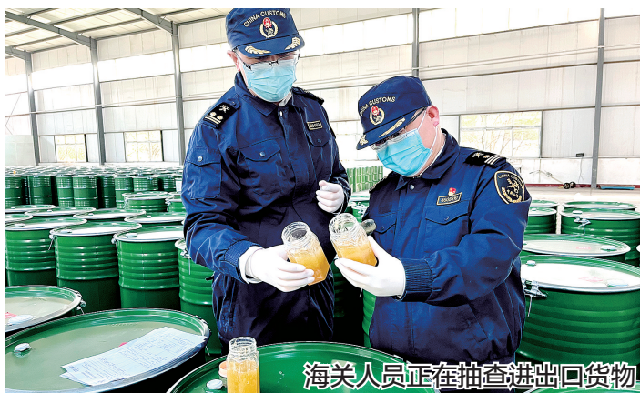
海关人员正在抽查进出口货物