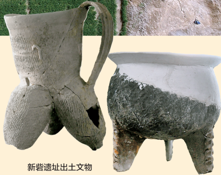
新砦遗址出土文物

从5300年前的巩义双槐树“北斗九星”遗迹具有特殊的政治礼仪功能,到4000年前的王城岗已初具礼乐体系的雏形,再到新砦得到快速发展,中国的礼乐文明在郑州、中原得以发端、光大,并一步步走上辉煌。