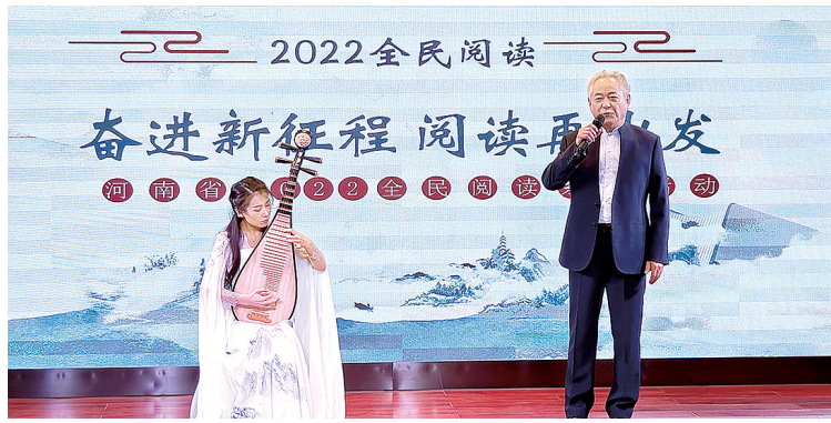
国家一级演员、著名话剧表演艺术家于同云,青年琵琶演奏家陈晔现场共同演绎配乐诗朗诵《琵琶行》

据介绍,河南省图书馆“2022全民阅读”系列活动贯穿全年,包括迎接中国共产党第二十次全国代表大会胜利召开系列活动、品读河南系列活动、培训推广计划、文旅融合活动、公共数字文化进基层活动、智慧阅读进校园活动、古籍保护传承与展示项目、“中华优秀传统文化传习行