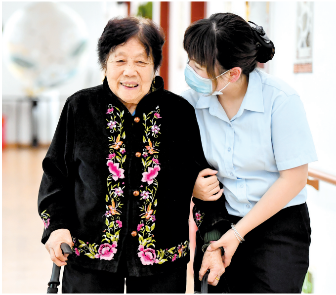
养老服务中心，护理员搀扶腿脚不便的老人行走

通知要求各地结合本地区实际，制定具体实施方案，于2022年5月31日前报人社部、财政部备案，并严格按照人社部、财政部备案同意的实施方案执行，把各项调整政策落实到位。要切实采取措施加强基本养老保险基金收支管理，提前做好资金安排，确保基本养老金按时足额发放。