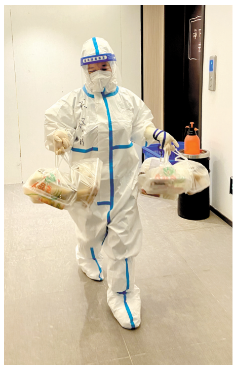
给大学生送吃的,满是“家”的味道