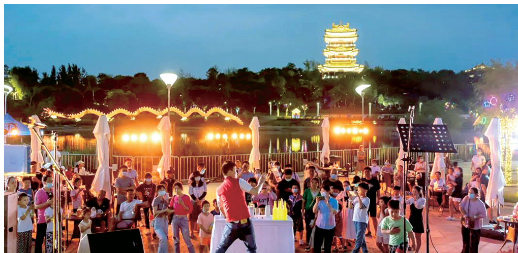
端午期间,市民在园博园避暑纳凉

本报讯(正观新闻·郑州晚报记者 成燕文/图)记者昨日从省文化和旅游厅获悉,河南今年端午假期仍以本地游为主,旅游市场总体趋势回暖向好。端午假期,全省共接待游客851.97万人次,实现旅游收入37.6亿元,与今年“五一”假期相比,分别增长38.49%、30.42%。