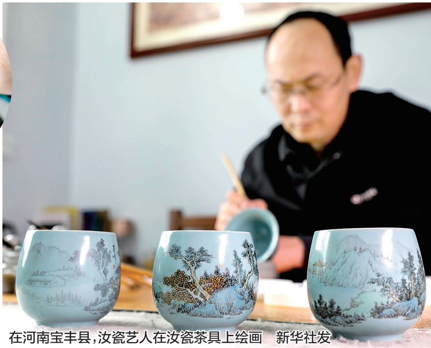
在河南宝丰县,汝瓷艺人在汝瓷茶具上绘画

本报讯(正观新闻·郑州晚报记者 秦华)6月11日是2022年“文化和自然遗产日”,我省将开展“非遗购物节”“云游非遗·河南影像展”“第二届河南省非遗曲艺展演周”等一系列线上线下非遗展演展示活动,带大家领略古老非遗文化魅力。