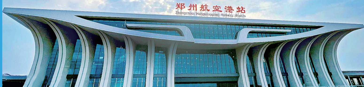
郑州航空港站 Zhengzhou Airport Railway Station