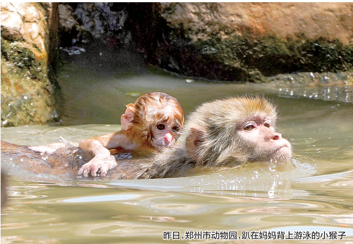
昨日,郑州市动物园,趴在妈妈背上游泳的小猴子

本报讯(正观新闻·郑州晚报记者 张华/文)这两天,郑州及周边地市热出新高度,6月17日郑州最高气温再次超过40℃,郑州被调侃成“蒸”州。这轮高温持续到何时?省气象台给出时间表,6月22日前,我省大部县市最高气温在37℃以上,北中部部分县市39℃~41℃。