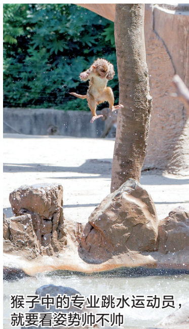
猴子中的专业跳水运动员,就要看姿势帅不帅