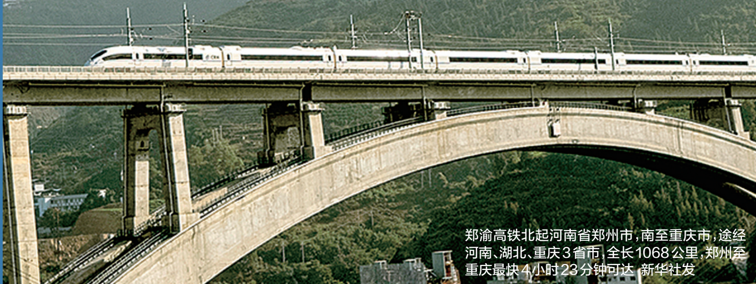
郑渝高铁北起河南省郑州市,南至重庆市,途经河南、湖北、重庆3省市,全长1068公里,郑州至重庆最快4小时23分钟可达