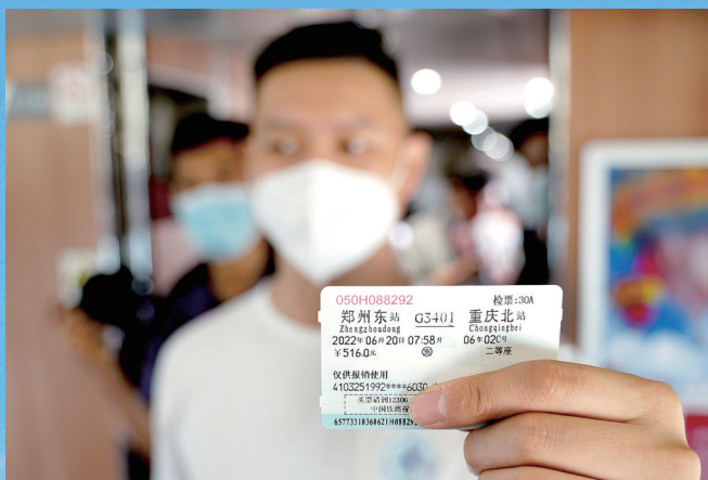
买张票,重庆走起