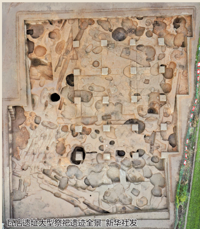
瓦店遗址大型祭祀遗迹全景

瓦店遗址发现于1979年,是河南省内的一处夏代早期都邑性遗址,先后被纳入“夏商周断代工程”“中华文明探源工程”“考古中国·夏文化研究”等重大考古项目。