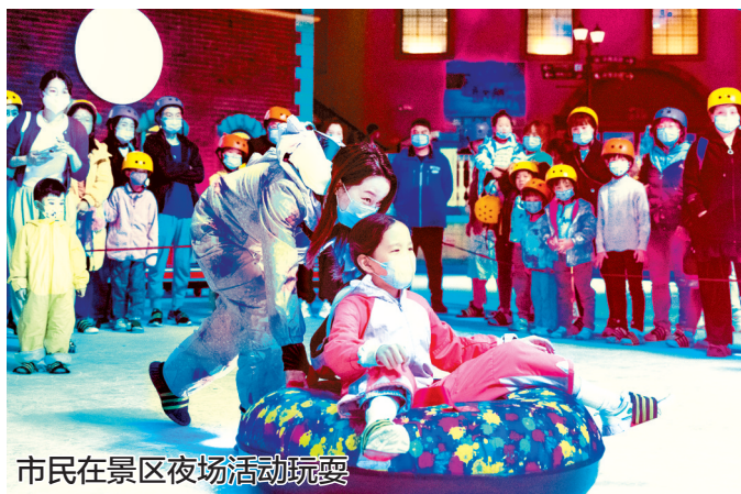
市民在景区夜场活动玩耍

同时,为刺激夏季文旅消费,郑州多家景区近日推出夜场活动。方特推出“方特欢乐世界啤酒音乐节”“方特梦幻王国熊熊