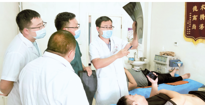
省骨科医院专家会诊病人

民生无小事,枝叶总关情。把人民健康放在优先发展战略地位,今年以来,聚焦破解县域医疗卫生领域群众看病就医难题,让群众在家门口就能享受专业的医疗健康服务,新密市中医院在市委市政府、市卫健委的领导下,全面落实省市部署和要求,探索建立以医院为龙头的医疗卫生服务共同体,实行“七统一”管理,开展“一院一策”精准帮扶,创新打造紧密型医共体建设“一家人、一条心、一本账、一根线”的新密模式,为人民群众生命健康保驾护航。记者 薛璐 通讯员 尤彩红 申红娟 文/图