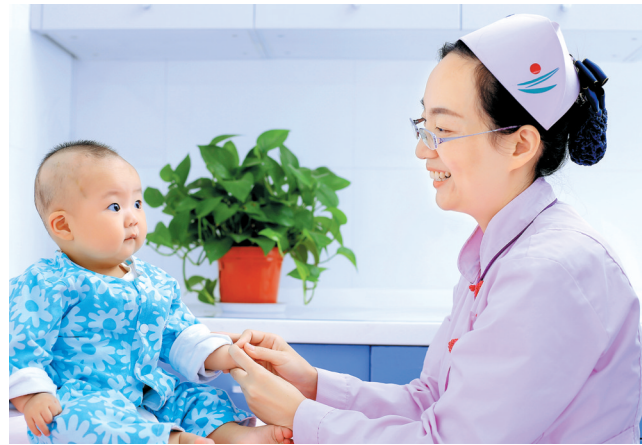
护士为宝宝做按摩

“依托智能化、数字化手段,打通基层患者就医的‘最后一公里’,也打通医院与各院区的‘信息孤岛’和‘业务壁垒’,让医共体内部真正实现互联互通、共建共享,推进优质医疗资源下沉,有效破解基层医疗卫生服务水平不高、能力不强的问题。”市中医院负责人表示。