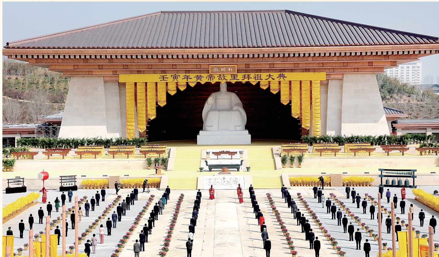
壬寅年黄帝故里拜祖大典现场