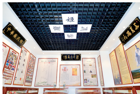
老家河南家谱档案馆