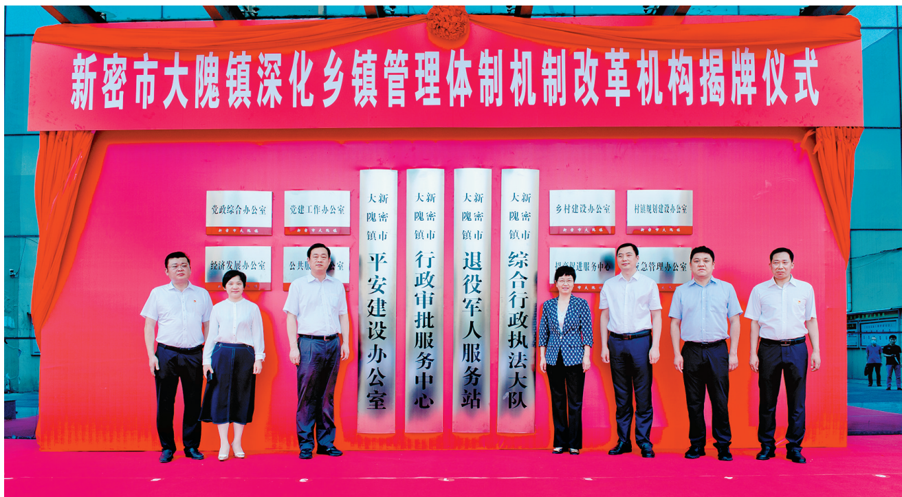
6月26日,大隗镇举行深化乡镇管理体制体制机制改革机构揭牌仪式