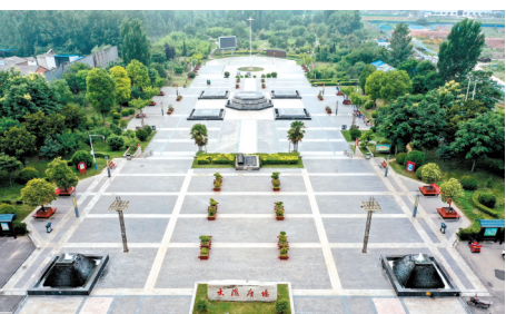
在全镇开展“基础设施大提升、镇区面貌大提升、人居环境大提升”行动

在镇区,以创建国家卫生镇为统领,开展镇容镇貌、交通秩序等专项整治活动。改造镇区道路3条9.07公里,改造地下管网3500米,规划停车位1775个,拆除违章建筑2处,投放垃圾箱300个,改造菜市场8500平方米,栽植苗木9万株,规范有序、亮绿净美