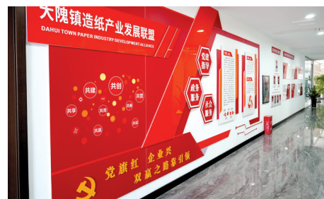
大隗镇探索组建造纸产业联盟,通过抓党建促产业、兴产业强党建