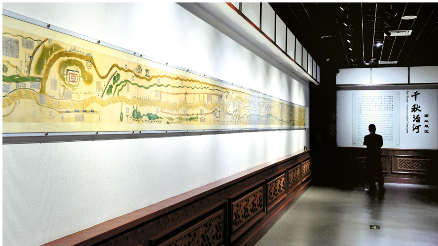
游客在黄河博物馆参观

规划明确,要构建黄河文物展示体系。以黄河文物为主要载体,协同黄河水利遗产、农业文化遗产、