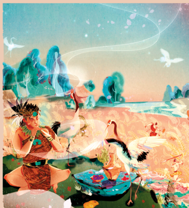
有声数字纪念票“贾湖骨笛”

赛事共分为报名阶段、创作阶段、评选阶段以及成果揭晓阶段等四个阶段。即日起至8月18日为报名阶段,开展学术导师招募行动和元宇宙创造者招募行动。有意者发送邮件至大赛组委会邮箱 hntmcc@163.com 即可报名参加。