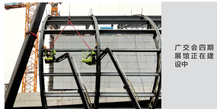
广交会四期展馆正在建设中