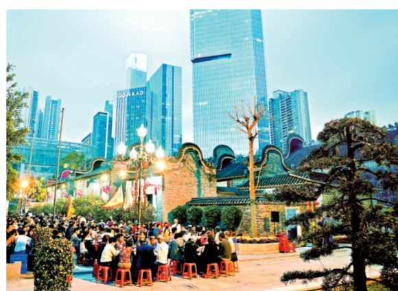
珠江新城的春宴。城市化过程后,广州传统文化生命力依然强劲