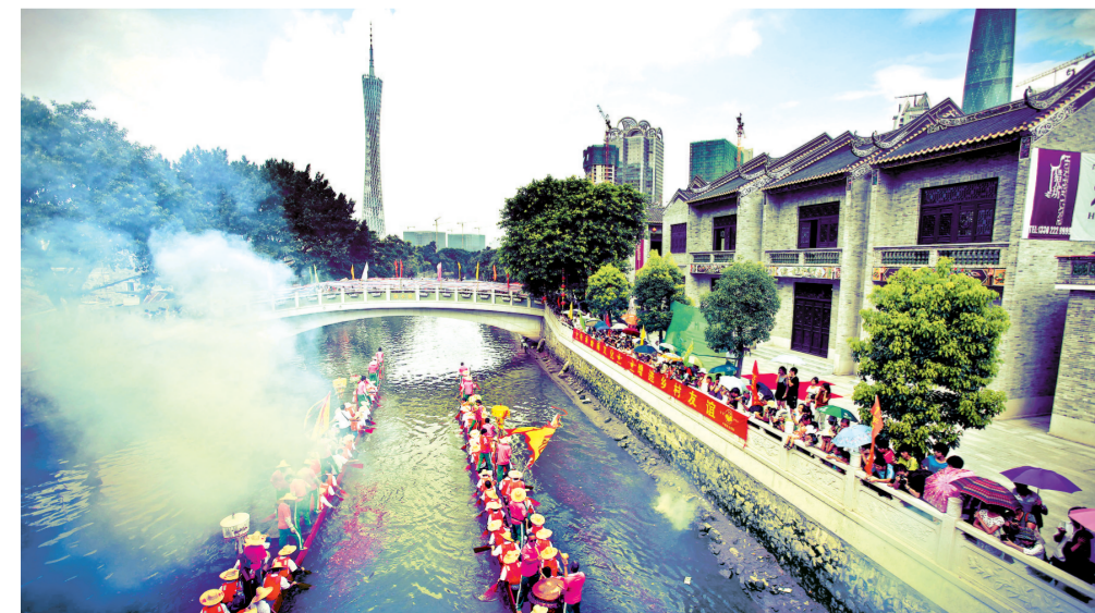
端午节猎德村龙舟全市会亲,传统驶入广州新城中心

有企业界人士认为,广州拥有一大批务实专注、敢于创新的企业家,相信只要激发中小企业的创新活力和发展动能,就能让中小企业发挥大作用,有望打造出全国“专精特新”发展新高地。