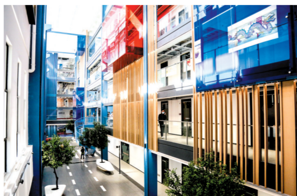
2021年12月10日,羊城同创汇(天河园区)开放揭幕仪式在羊城创意产业园举行