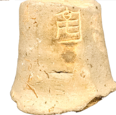
写有“亳”字样的出土文物

第一展厅展示早商王都布局规划的大型复原沙盘让人眼前一亮,数字投影和大型立体复原沙盘、视频解读相结合,生动呈现郑州商代都城的整体布局和功能分区。郑州商代都城是早商时期规模最大的城址,奠定了后世中国古代都城的基本规制。