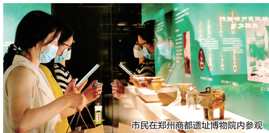
市民在郑州商都遗址博物院参观

在充分总结首届“博博会”成功经验的基础上,组委会经过精心策划与筹备,2006年9月17日至20日,第二届“博博会”在位于北京的全国农业展览馆举办,主题为“博物馆与青少年”。展览总面积8200平方米,比首届扩大2200平方米。主要展览内容在第一届基础之上进行