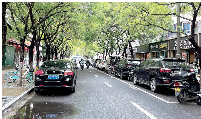
政七街被违停车辆挤得只剩中间一条道

本报讯(正观新闻·郑州晚报见习记者 韩思萌 文/图)“在这儿附近上班的人多,吃饭时都会来这边的饭店,一到饭点,堵得根本走不动。”近日,有市民向“郑在办”媒体助政帮办平台反映,纬五路(政六街至政七街)、政七街(纬四路至纬五路)违停现象严重,造成附近居民出行困难。针对此事,记者进行了实地探访。