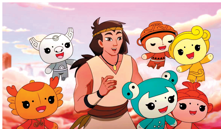
《黄河传奇》先导片剧照

黄河文化创新成果发布会由中共河南省委宣传部、水利部黄河水利委员会指导,民建河南省委会、河南省发展和改革委员会、河南省文化和旅游厅、黄河水利委员会宣传中心联合主办。