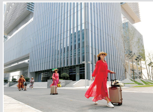
金融岛成为不少人的游玩拍照打卡地