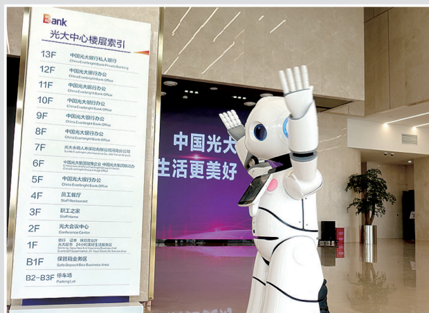
金融岛内科技感满满的办公环境

从一纸规划、一张蓝图、一片工地到风景如画、宜居宜业科技之城,郑东新区北龙湖金融岛、龙子湖智慧岛等像被施了“魔法”一般拔地而起,为更多创新创造打开“筑梦空间”。