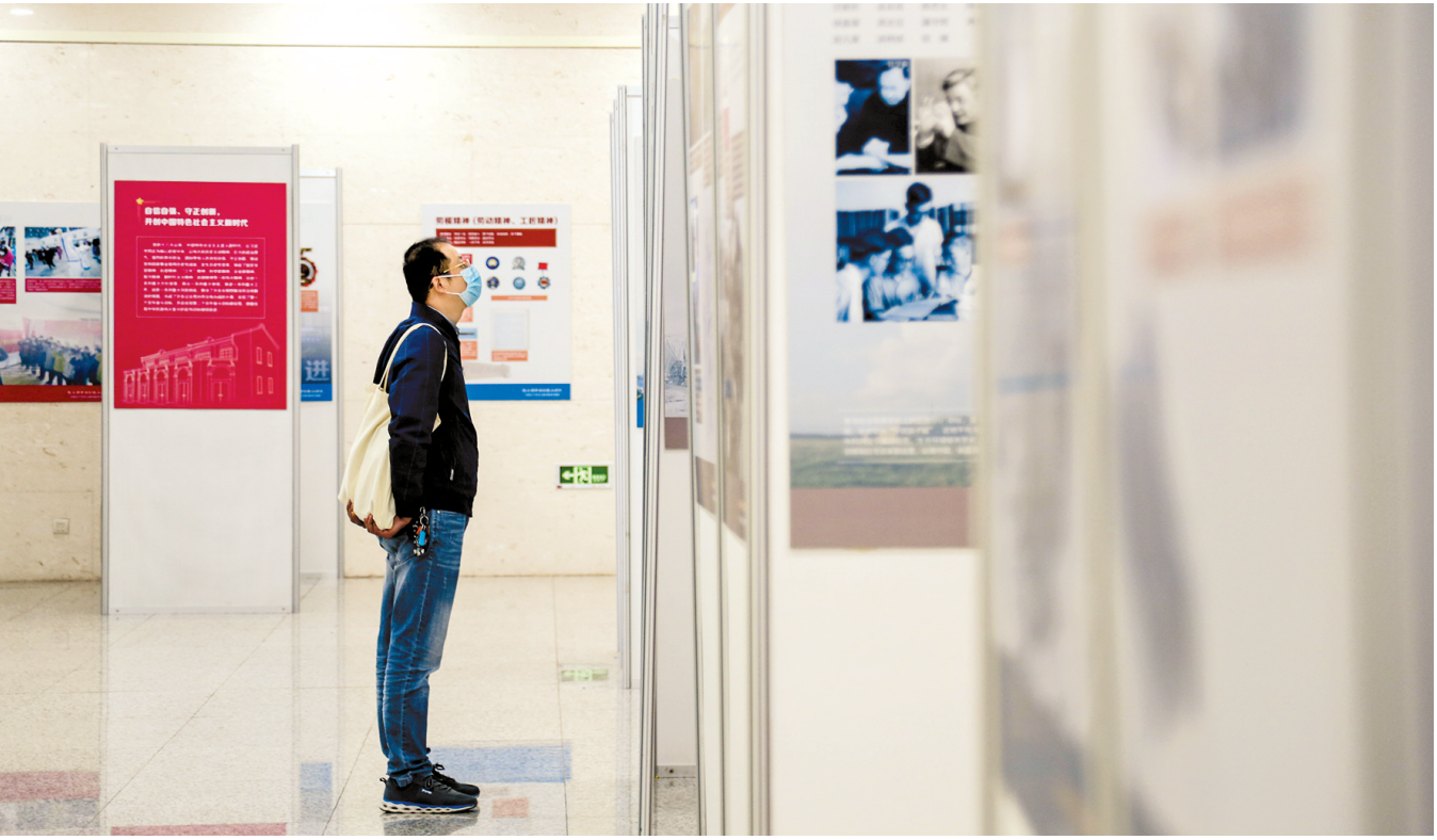
市民正在认真观展

本报讯(正观新闻·郑州晚报记者 成燕 通讯员 张幸格 文/图)一段岁月,波澜壮阔,刻骨铭心;一种精神,穿越历史,辉映未来。昨日,由中国共产党第一次全国代表大会纪念馆、上海图书馆、郑州市文化广电和旅游局主办的“伟大精神铸就伟大时代——中国共产党伟大建党精神专题展”在郑州图书馆正式开展。 本次展览以中国共产党人精神