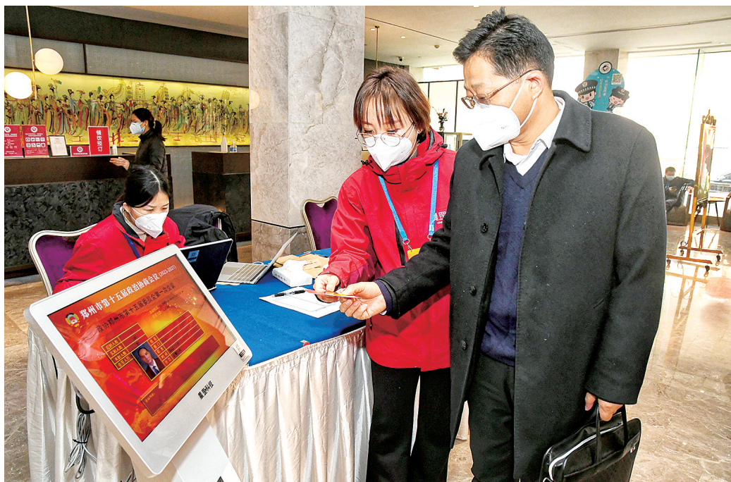
1月2日,参加郑州市政协十五届一次会议的政协委员报到

在一些不足,需要规范管理:“在后疫情时代,应加快出台集体经济房屋租赁减免政策指导性文件,为集体物业免租实施提供政策依据。”