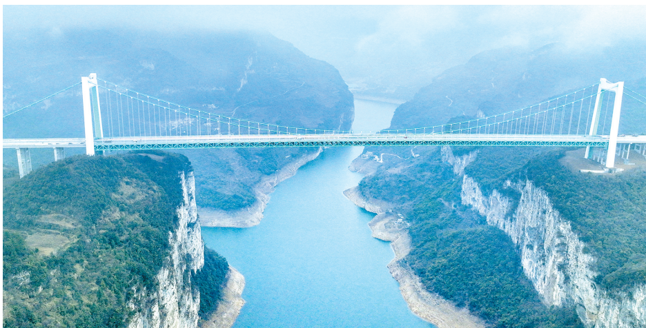
贵州金烽乌江大桥(无人机照片)

作为全国唯一没有平原支撑的省份,贵州已建和在建的桥梁近3万座。一座座架设在高山峡谷间的世界级大桥,让“地无三里平”的贵州铺就畅行无阻的高速网络,变成了通江达海的“高速平原”。