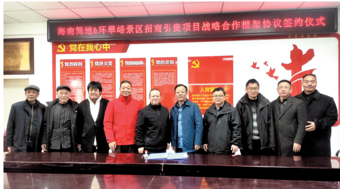
与海南简道签约合作