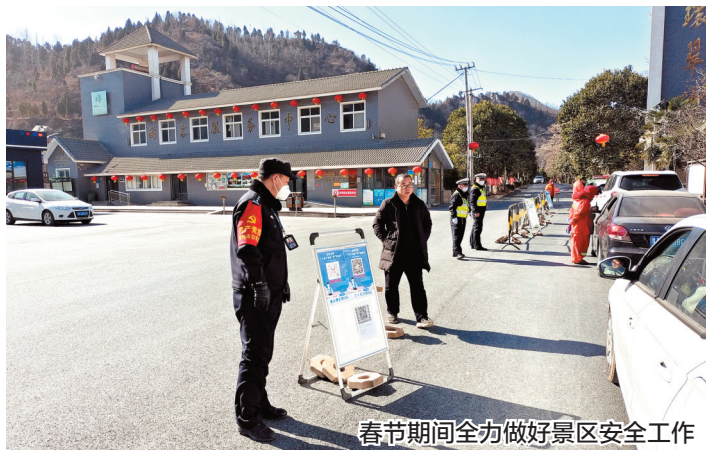
春节期间全力做好景区安全工作