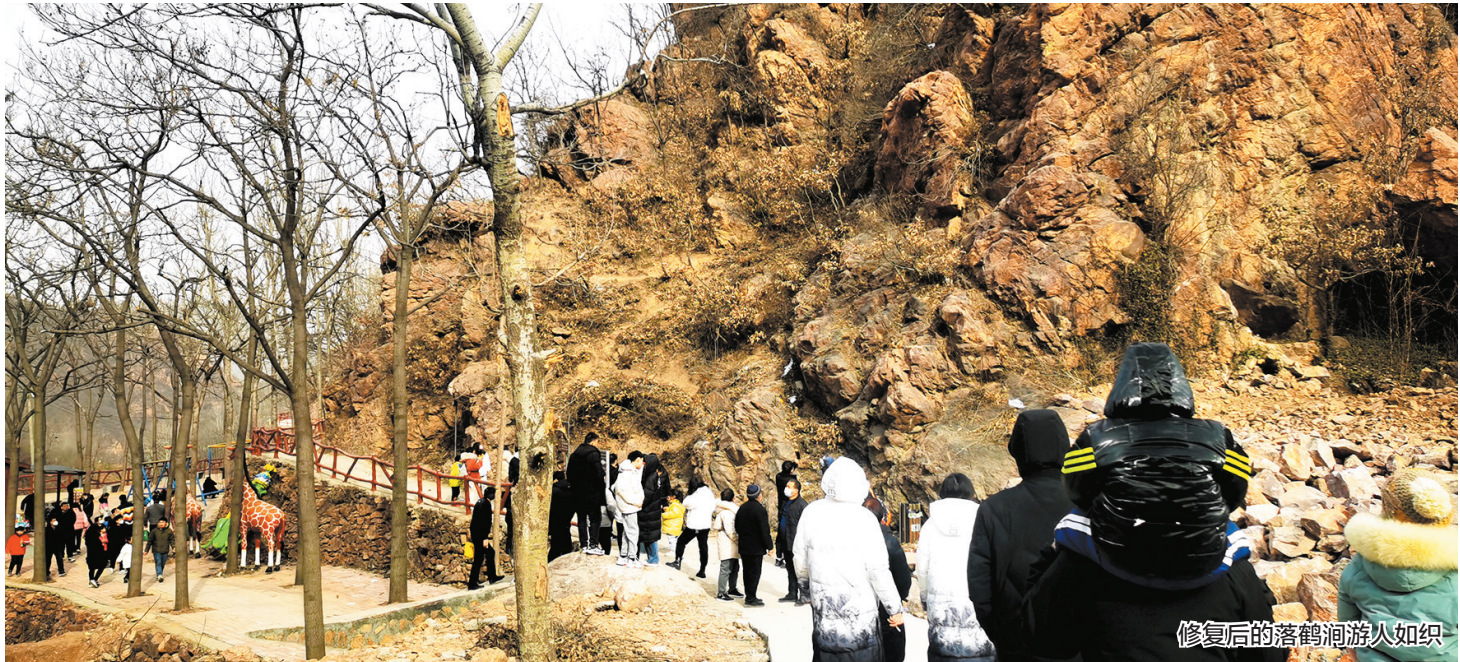
修复后的落鹤涧游人如织

2022年,环翠峪风景名胜在荥阳市委市政府的坚强领导下,树立“三标”意识,勇于克难攻坚,坚持党建引领,把握“稳中求进、奋发有为”的总基调,紧盯“脱贫攻坚与乡村振兴有效衔接和景区各类基础设施恢复提升”两个重点,让本就美丽的景区不断绽放新颜。