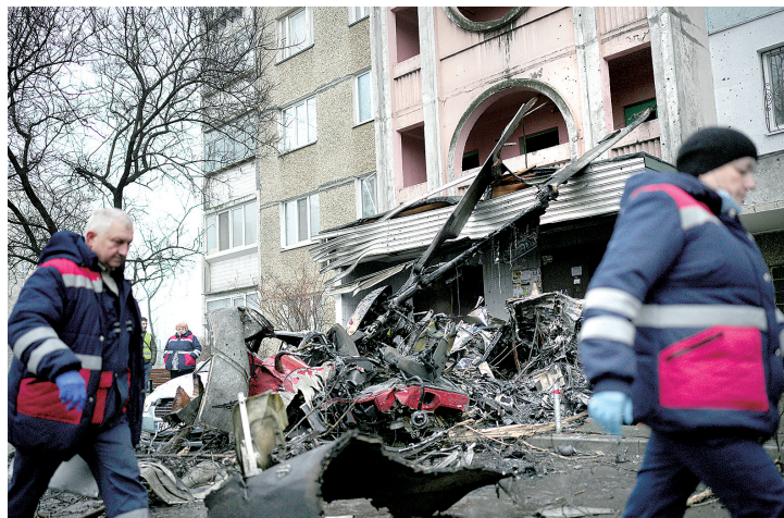
1月18日,基辅布罗瓦雷的直升机坠机现场

除了在能源领域“巧取”外,美国还通过《通胀削减法案》对欧洲进一步“豪夺”,以高额补贴等激励措施,推动电动汽车和其他绿色技术在美国本土的生产和应用,这给欧洲国家造成产业外迁压力。尽管欧盟方面一直争取美方平衡欧洲企业利益,但并未取得实质性结果。