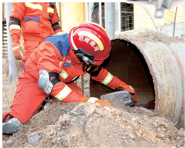
实战拉动演练现场

本报讯(正观新闻·郑州晚报记者 汪永森 实习生 安欣欣 文/图)2月20日至22日,郑州市消防救援支队高标准完成“守护绿城2023”地震灾害救援实战拉动演练,有效检验了全市消防救援队伍、提高了地震灾害救援力量体系和能力建设水平,全面掀起“开局即决战、起步即冲刺”全员岗位大练兵序幕。