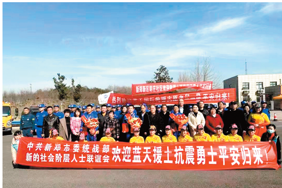
日结束救援任务返回到伊斯坦布尔休整,受到华为(土耳其)公司热情款待, 2月20日返回国内。

采访中,勇士白良告诉记者:“我们2月10号出发,新郑队一行3人和河南省蓝天第二梯队共计14人,在任务作业点卡赫拉曼马拉什,截至任务结束,共计搜索13个楼体,大约6000平方米,搜索出21具遇难者,幸存者1名。”2月18