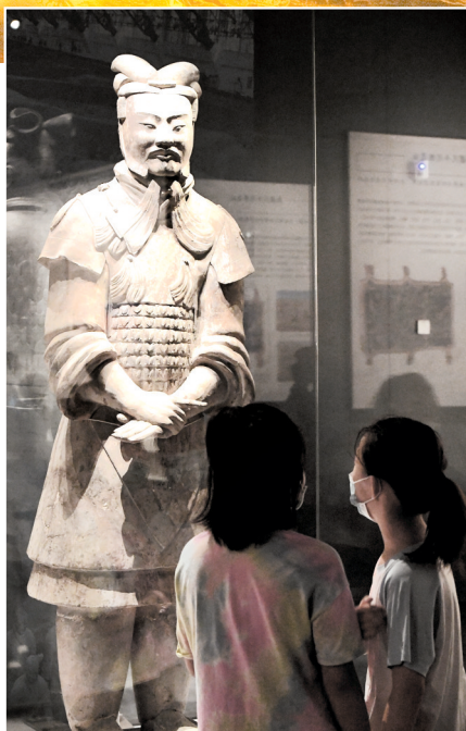
中国百年百大考古发现展

我省除郑州外的3个参加初评的展览,分别为:开封市博物馆“世间遗迹犹龙腾——王羲之与《十七帖》特展”、中国文字博物馆“文以化人 字以载道——中国文字博物馆续建工程基本陈列”、洛阳隋唐大运河文化博物馆“国运泱泱——隋唐大运河文化展”。