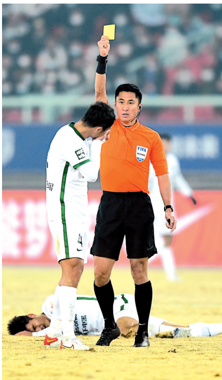
裁判在比赛中出示黄牌

会议还明确,俱乐部方面“抗议”针对的是影响联赛比赛正常进行的事件。“事件”包括比赛草坪状况、场地标记、标线、比赛装备、球员比赛资格、体育场设施、比赛用球等,但不包括争议判罚。