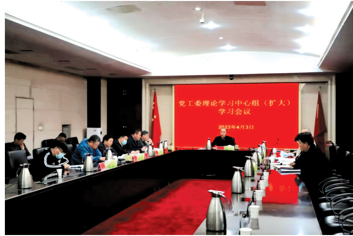
大党员干部的风险防范能力、应急处突能力。时刻保持头脑清醒,居安思危,切实增强风险意识和底线思维,更好地统筹好发展和安全,始终绷紧安全风险这根弦。

张红军强调,要强化政治意识、责任意识、风险防范意识、忧患意识,深入领会、把握关键、做好工作,发挥好职能作用,提高广