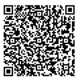
扫码看视频 带你逛公寓

截至目前,全市人才公寓约20万套(间),2023年计划陆续投入运营的人才公寓3万多套(间)。后续有房源达到配租条件,将会在“郑好办”APP上及时发布。