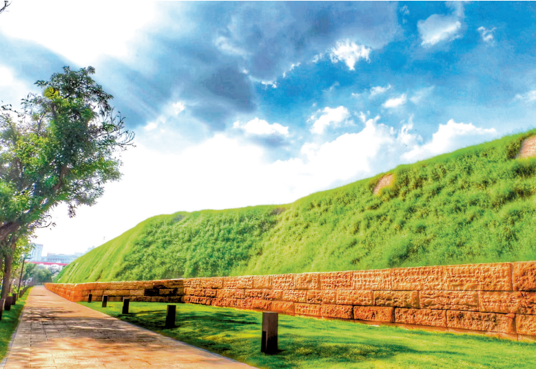
郑州商城国家考古遗址公园

是我市众多考古遗址公园建设的一个缩影。未来,我市将有更多考古遗址公园精彩绽放——2022年11月,巩义双槐树遗址、新密古城寨城址、巩义宋陵入选第一批河南考古遗址公园立项名单,2022年12月,巩义宋陵入选第四批国家考古遗址公园立项名单。此外,登封大周封祀坛遗址生态文化公园等也正在建设中。