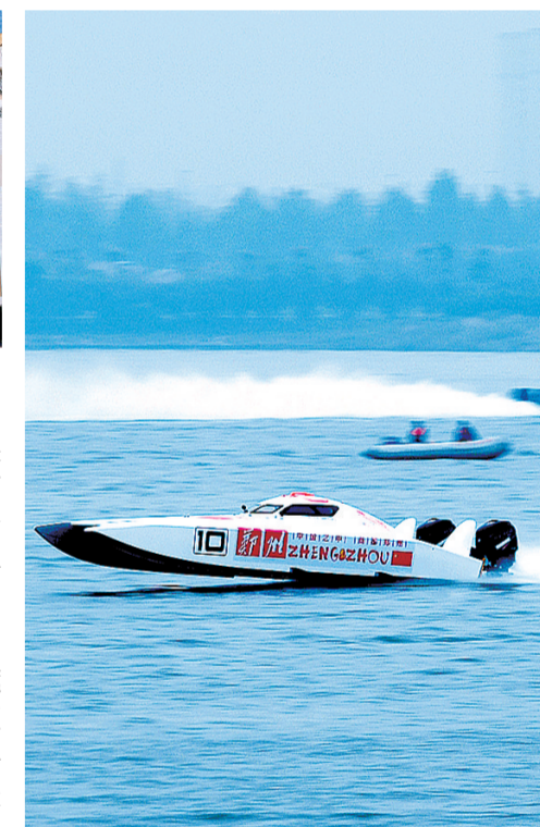
2017年10月,“一带一路”世界摩托艇锦标赛郑州站在郑东新区龙湖水域举行