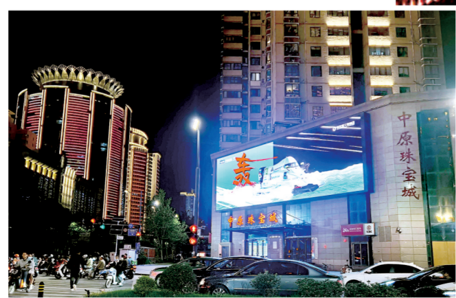
中原珠宝城大屏显示摩托艇大赛内容