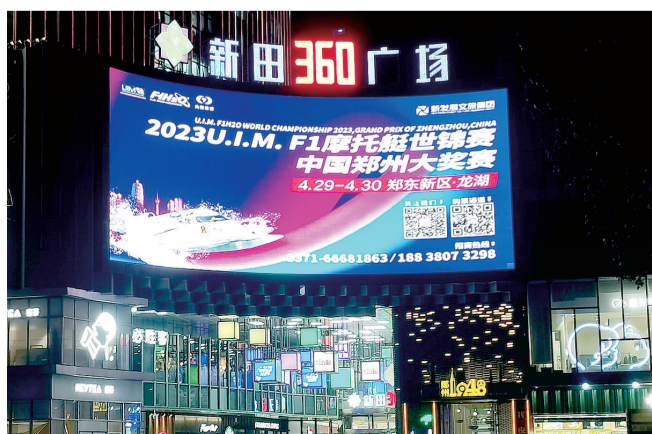
商场外大屏滚动播放F1摩托艇大奖赛宣传片

环形地下道路中交通参与者的心理状况和心理预期。同时,郑东新区对原有的标识牌尽量原位利用,不能在原地利用的标识牌移位利用,最大限度地避免了工程浪费。