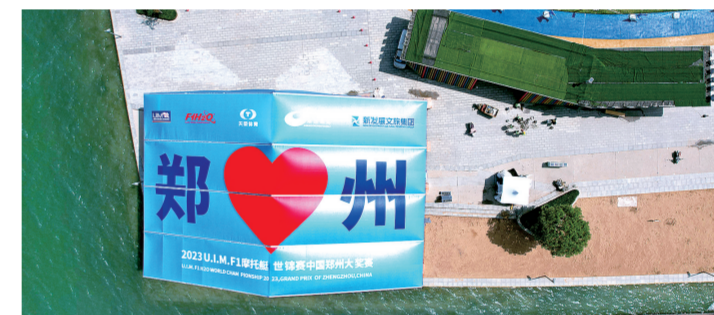
2023年4月25日,龙湖边搭起的F1大奖赛观光亭

暮春时节,郑东新区龙湖碧波荡漾、飞鸟成群,湖光映照下的金融岛熠熠生辉,灵秀动人美景之中,前来拍照打卡、休闲娱乐的市民络绎不绝。10年前,龙湖还只是一片黄沙芦苇地,如今,F1摩托艇世界锦标赛中国郑州大奖赛即将在这里精彩登场,这里成为世界认识新郑州、感受新发展,全面展示中国式现代化“郑州图景”标志性窗口。