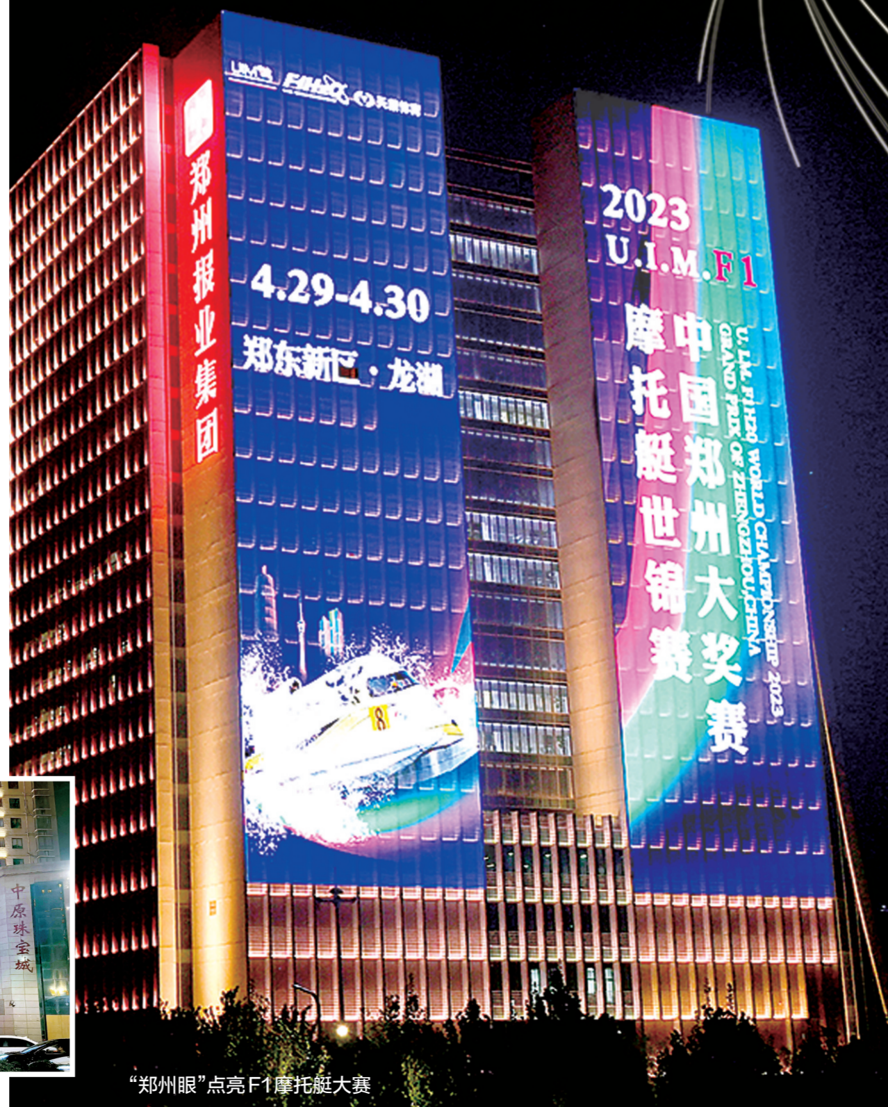
“郑州眼”点亮F1摩托艇大赛