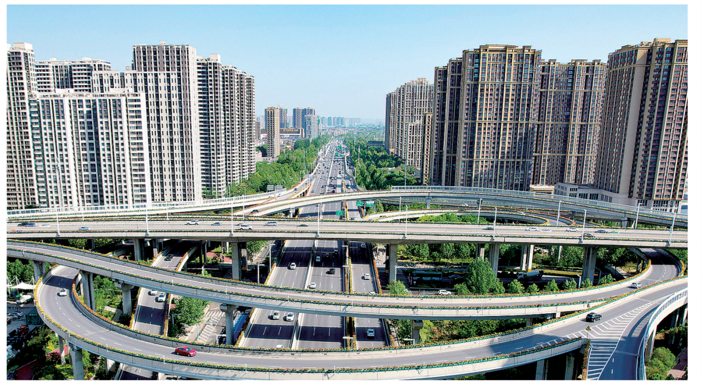
西三环陇海路立交